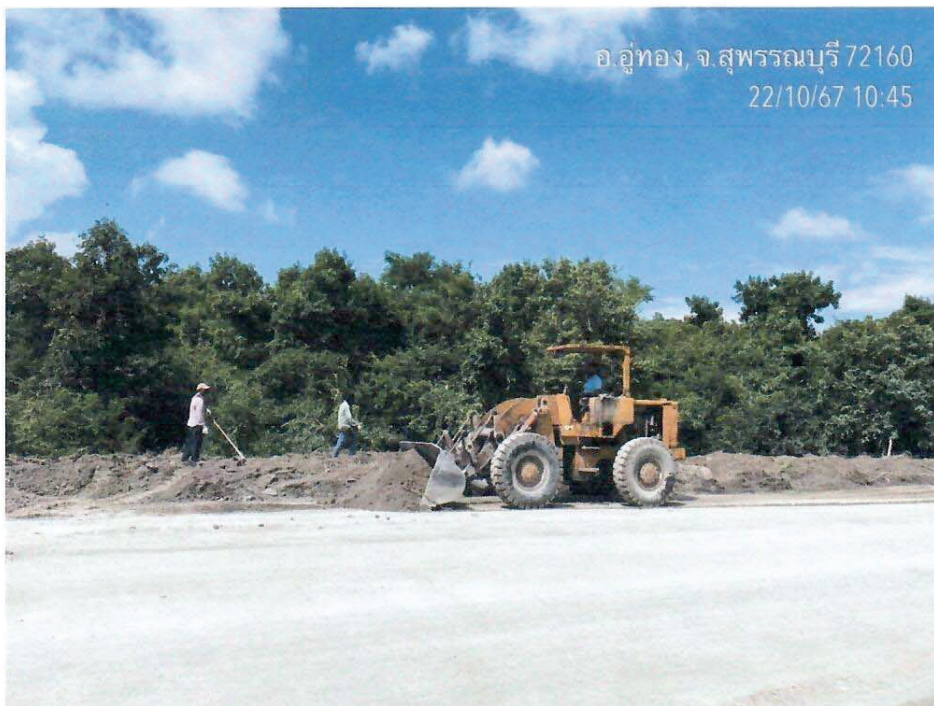
รูปที่ 1 และ 2 การเตรียมพื้นที่ในการปลูกต้นไม้ โดยการทำเป็นคันกันขอบถนนในบริเวณเขตประทามบัตร โดยมีพื้นที่จำนวน 500 ตารางเมตร ( 1 งาน 25 ตารางวา )