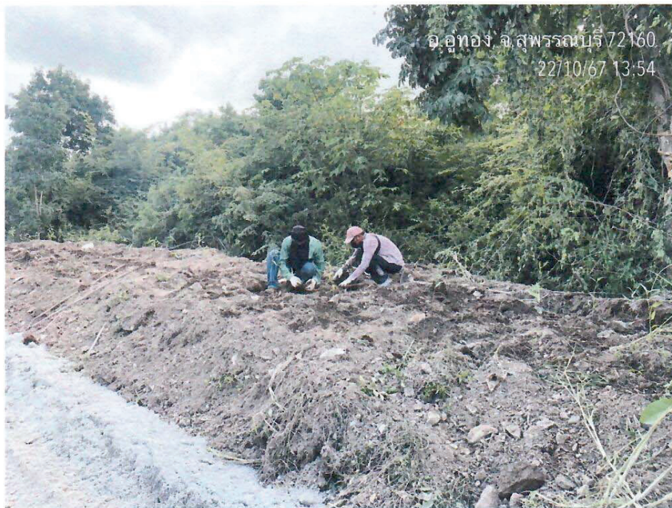
รูปที่ 3 และ 4 ลงมือปลูkdต้นไม้ ในบริเวณพื้นที่ที่เตรียมไว้ โดยต้นไม้ที่นำมาปลูกเป็นต้นยูคาลิปตัส