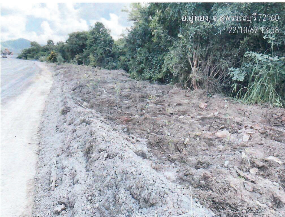
รูปที่ 5 และ 6 ดินไม้แห้งปลุกลงดิน